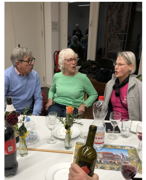
Ein paar Zäuerli zum guten Abschluss eines denkwürdigen Neujahrsapéros