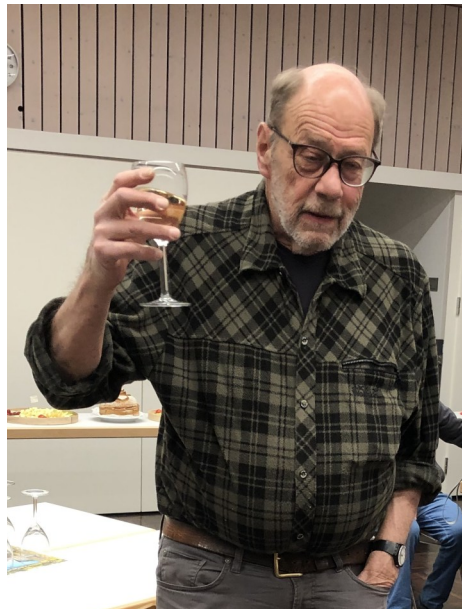
...dennoch oder erst recht: allne e guets neus Jahr