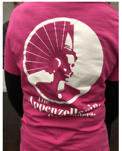
Feines auf dem Buffet und im Glas—und mittendrin die Appenzellerin