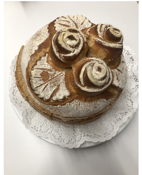
...und Rosen auf dem Brot