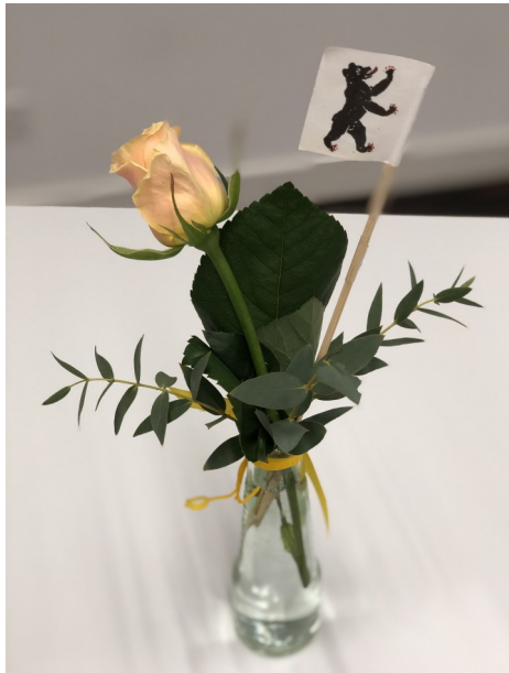
Rosen auf den Tischen...