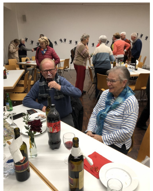
Momentaufnahmen vom Neujahrsapéro