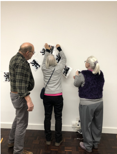
Miteinand goht's besser