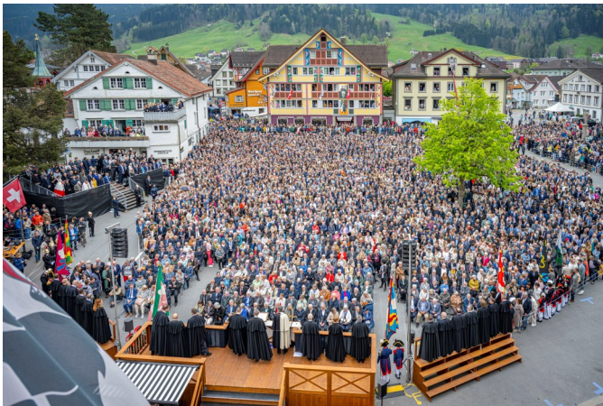
Landsgemeinde 2025 in Appenzell: grosser Aufmarsch und grosses Publikums-Interesse