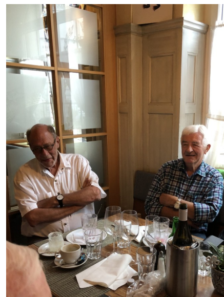
Zufrieden: ein Ausser- und ein Innerrhoder