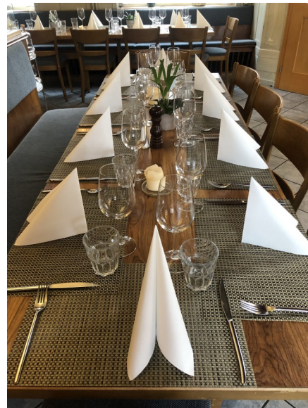
Alles bereit im «Bundesbähkli»