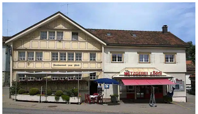
Erstmals seit 1897 kommen die Würste für das «Worschtmöbli» aus dem Appenzeller Vorderland, aus Heiden