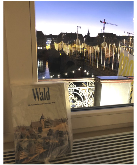
Wald AR in Basel, Heimatort des Präsidenten