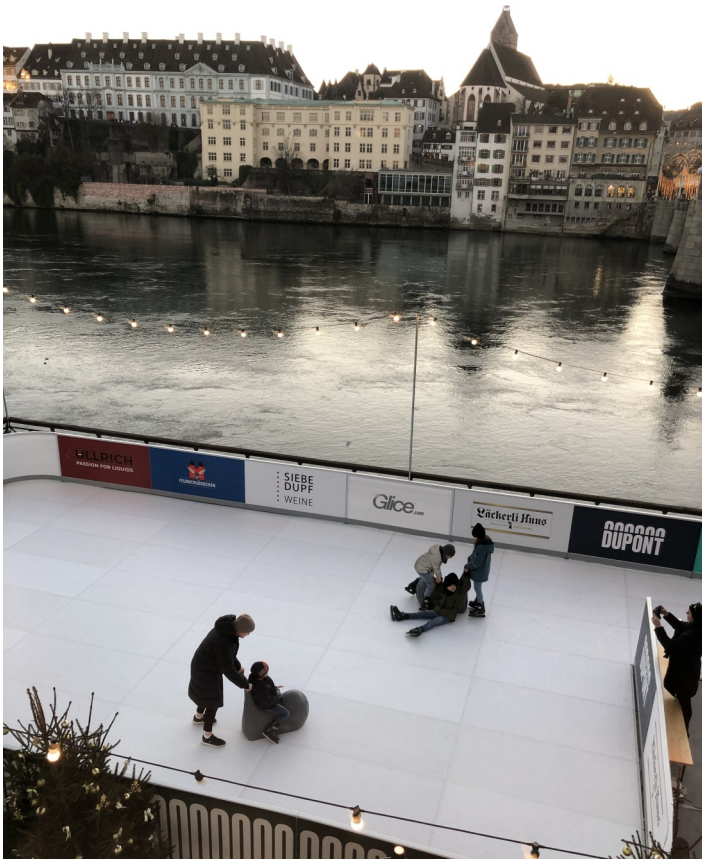
«Eis»-Feld beim Hotel vor dem Panorama des Rheinsprungs