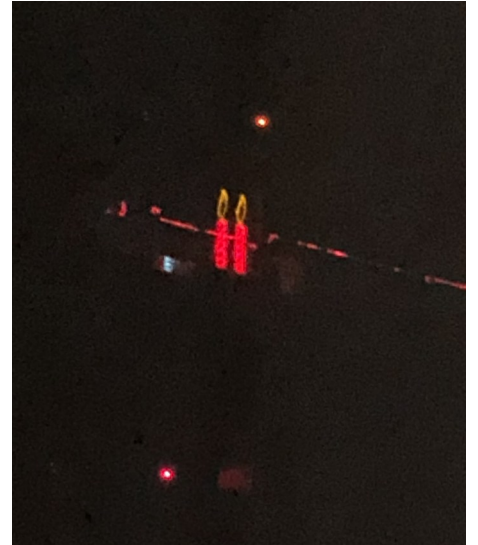
Hoch oben am Kran etwas Weihnachtsstimmung