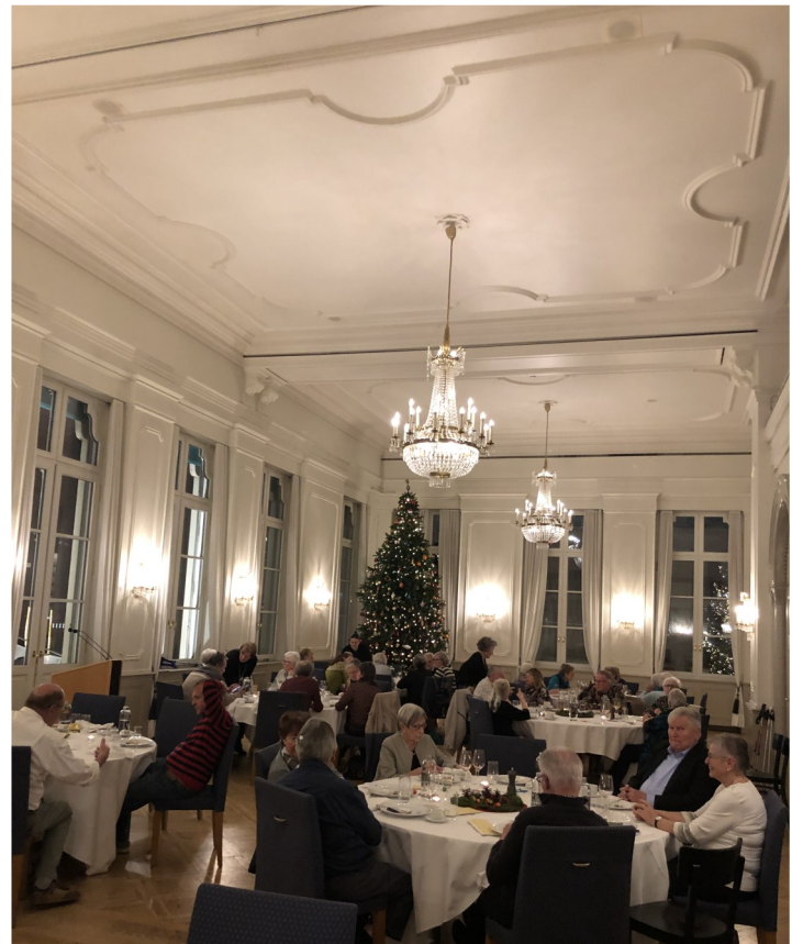
Ein wunderbarer Saal!