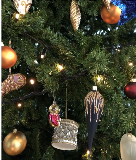
Wie jedes Jahr: prächtig geschmückt