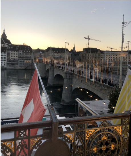
Draussen Weihnachtsmarkt, drinnen -feier