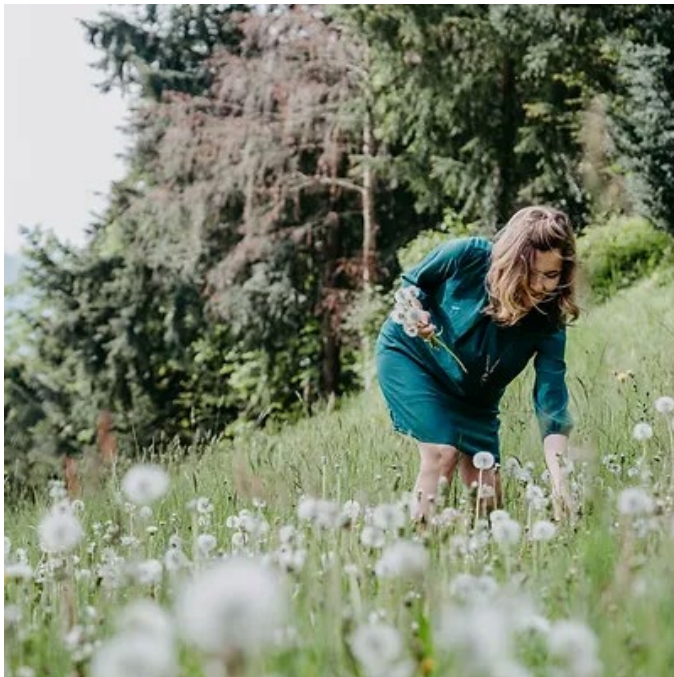
«Sonnwendlig» & «Zischgeli»